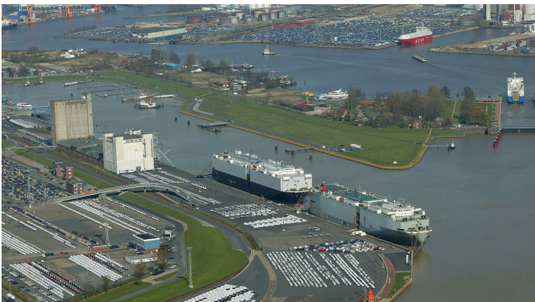
Die Schlagader Emdens ist der Hafen. Von dort machen sich - neben vielen anderen Schiffen - die Autotransporter auf den Weg nach Amerika. Aber auch die Kreuzfahrtschiffe der Meyer-Werft werfen Anker zum Ausrüsten.