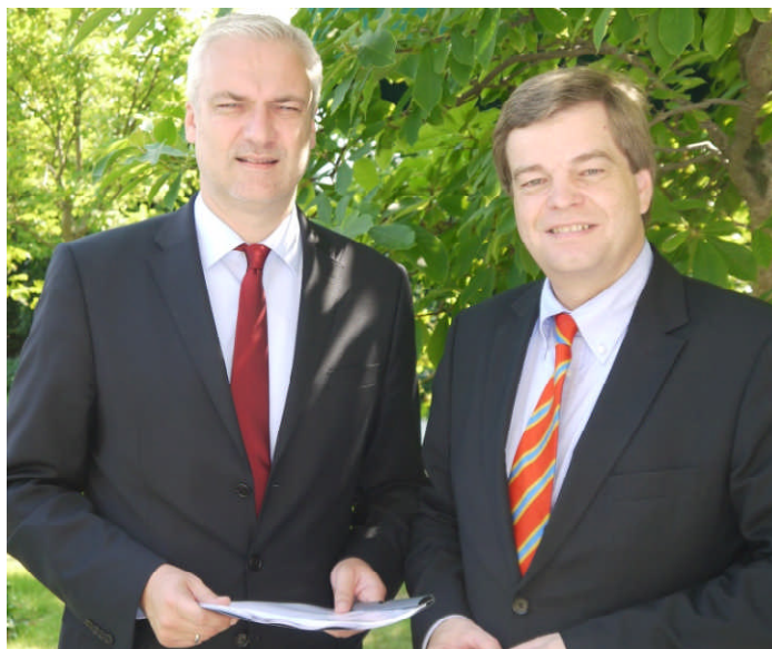
Garrelt Duin (links) überreichte in Berlin dem Parl. Staatssekretär im Verkehrsministerium, Enak Ferlemann, CDU, ein Papier zur Emsvertiefung bei Emden.

Unabhängig von der Emsvertiefung zwischen Emden Richtung Knock wartet am Rysumer Nacken mit einem neuen Hafen ein Vorhaben, das die Zukunft Emdens für die nächste Generation sichert. Der Stadtrat hat seine planerischen Hausaufgaben dafür gemacht. Jetzt sind Land und Bund mit einem Geländetausch an der Reihe, damit das Land in den Grundstücksbesitz am Rysumer Nacken gelangt.