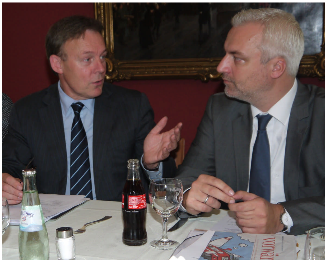
Der Parlamentarische Geschäftsführer der SPD-Bundestagsfraktion, Thomas Oppermann (links), im Gespräch mit Garrelt Duin. Der Göttinger Oppermann und der Ostfriesen Duin sind sich einig, dass die SPD mit einem gut austarieren Programm mit den Schwerpunkten Sozial- und Wirtschaftspolitik wieder an die Regierung kommen kann.

Die Botschaft der SPD an die Wähler müssen sein: „Die Regierung kann es nicht, wir können es besser.“ Um die Erwartungen der Menschen jedoch zu erfüllen, sei weiterhin solide Arbeit an Kompetenz und Profil der Partei nötig. Bis zum Parteitag Anfang Dezem-