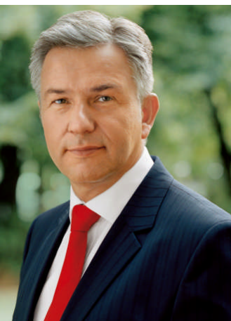
Klaus Wowereit kommt nach Pewsum.

Die Sozialdemokraten laden am Mittwoch, 17. Februar, ins „Kolossaal“ in Pewsum/Krummhörn ein. Beginn ist um 19:00 Uhr. Der Einlass ist